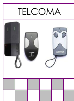
TANGO, SLIM Y EDGE