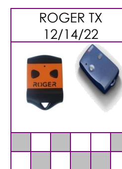
TX12, TX14 Y TX22