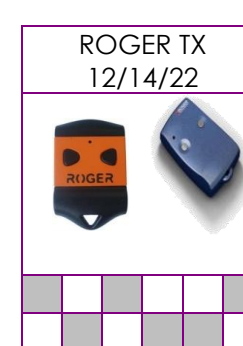
TX12, TX14 Y TX22