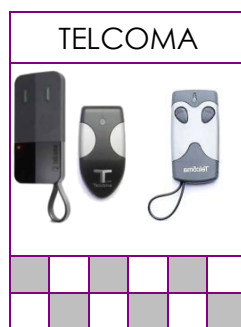
TANGO, SLIM Y EDGE